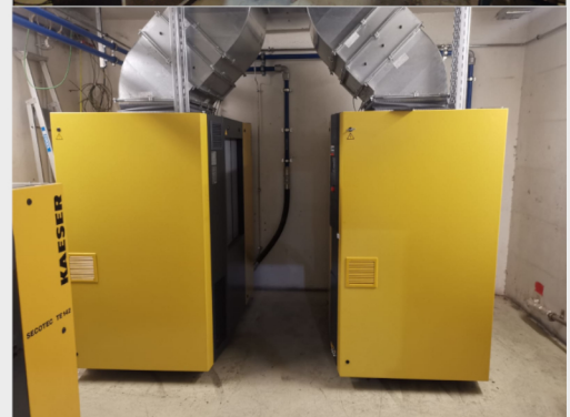
Aus alt mach neu. Der neu ausgelegte Kompressorraum ist jetzt viel effizienter und garantiert ein leistungsoptimiertes Arbeiten.